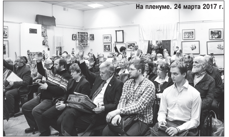
На пленуме. 24 марта 2017 г.

То есть — окончательную точку в приеме ставит Приемная комиссия Союза писателей России на Комсомольском, 13. В истории этого вопроса есть штрих: в свое время Московская областная писательская организация вышла из состава Московской городской. И при этом оставила себе право, как и Москва, самостоятельного приема. На Пленуме эта практика была прекращена и отныне, а точнее с 24 марта с.г. кандидаты, вступающие в московскую областную писательскую организацию, утверждаются на Комсомольском, 13, после заседания Приемной комиссии. Как и вся Россия.